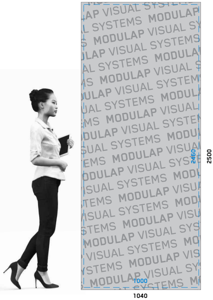
BEISPIEL: MOTIV ÜBERGREIFEND ÜBER 2 ODER MEHR MODULE EXAMPLE: OVERLAPPING MOTIFS COVERING 2 OR MORE MODULES